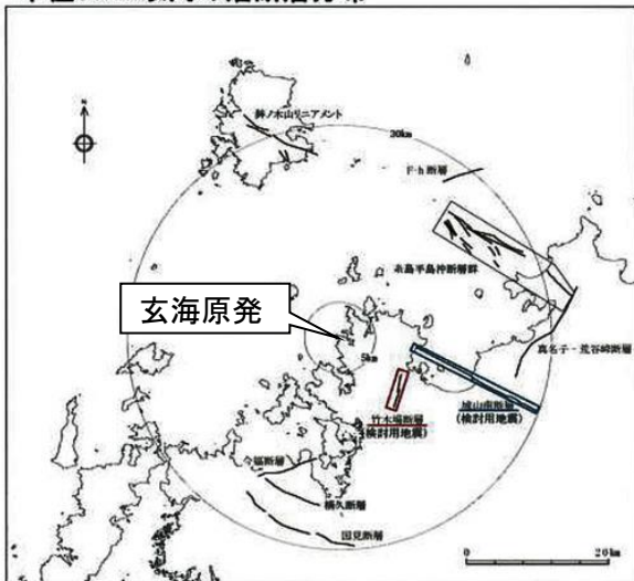
半径30km以内の活断層分布